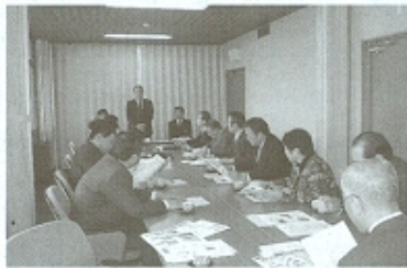
昭和のまちづくり「豊後高田市」を視察

昨年十二月二十日から二十二日まで、子育て支援、観光まちづくりを目的として大分県別府市、豊後高田市、湯布院町を視察しました。