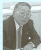
小池政調会長のすばらしいアイデアをもとに、これまで四回にわたって十七人のインタビューを掲載してまいりました。読みやすく、面白い記事にまとまると自負しています。

私の夢は、押上にも新東京タワー誘致を実現し、そこに吉良の屋敷を併設して皆さんに本物の忠臣蔵歌舞伎を楽しんでもらうこと。ご協力をお願いします。(中沢記)