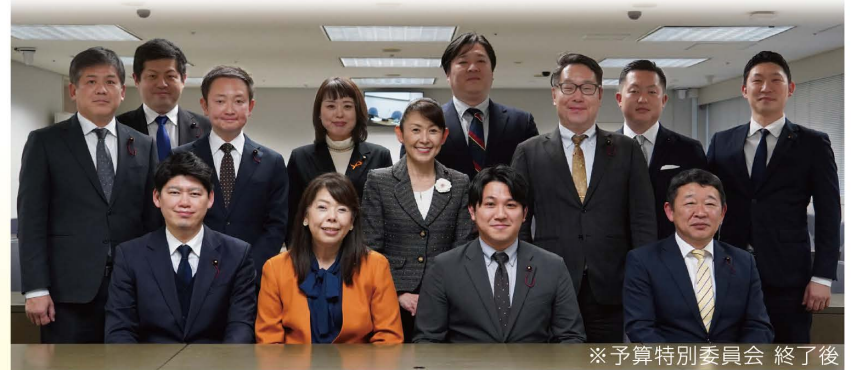
※予算特別委員会 終了後