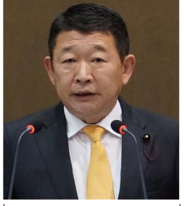
墨田区議会議員 たきざわ 正宜