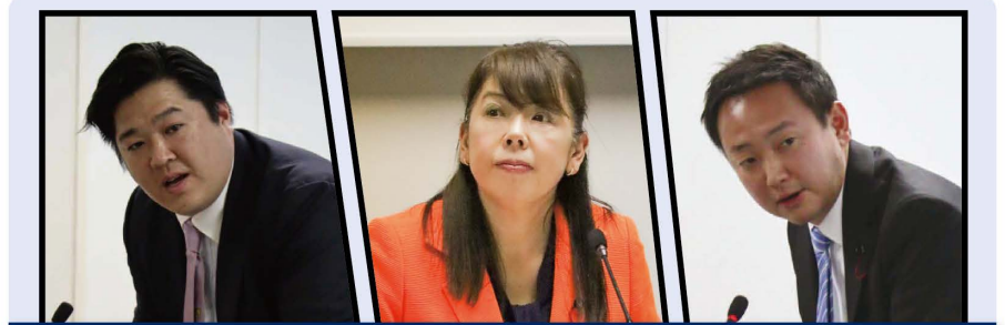
子ども文教委員会

墨田区庁舎リニューアルプランの改定について 供用開始から34年が経過した墨田区庁舎で、時代のニーズに即した改修を進めるため、計画の改定を議論しました。庁舎内トイレの洋式化といった「利便性の向上」、職員の働き方改革を通じて区民サービスの向上を目指す「DXの推進」等、住民の方々の利便性はもちろん、区職員の方々の働き方改革にもつながるよう、着実な計画の推進を要望しました。