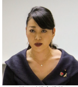
墨田区議会議員 中沢 えみり